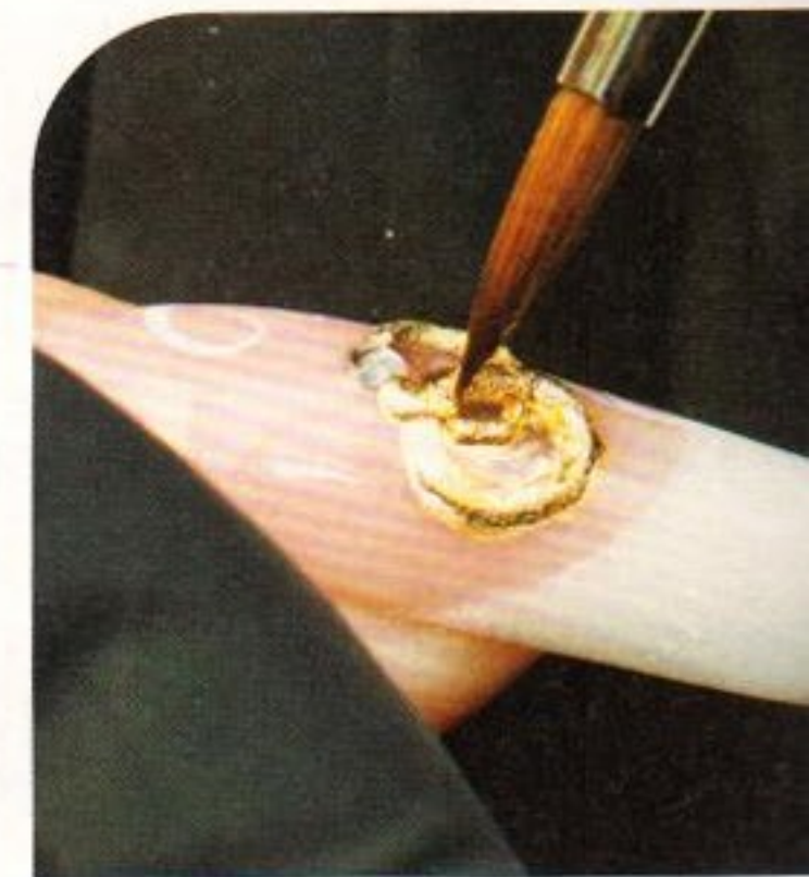
6 Als Highlight werden auf einem goldenen Powder zwei Trauringe dreidimensional modelliert. Ein Strassstein wird zusätzlich mit einem Strassstein verziert.