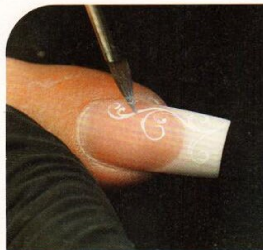
5 Mit einem feinen Pinsel und weißer Acrylfarbe werden filigrane und verspielte Rankenmuster auf alle Nägel gemalt. Danach werden die Nägel versiegelt.