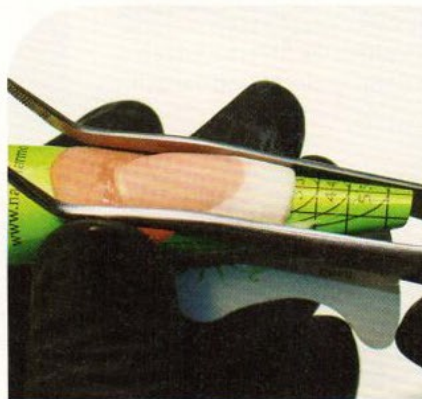
3 Mit einer Pinzette wird die Modellage gepincht, um einen optimalen Tunnel zu erzielen und dadurch auch die Stabilität und Statik der Nägel zu verbessern.