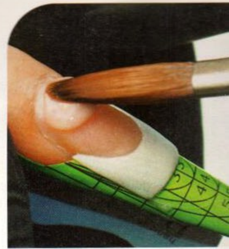
2 Mit einem Bällchen Pink wird der Nagelaufbau vervollständigt. Wichtig ist, dass hierbei die Arch und der Streifenbereich korrekt ausgearbeitet werden.