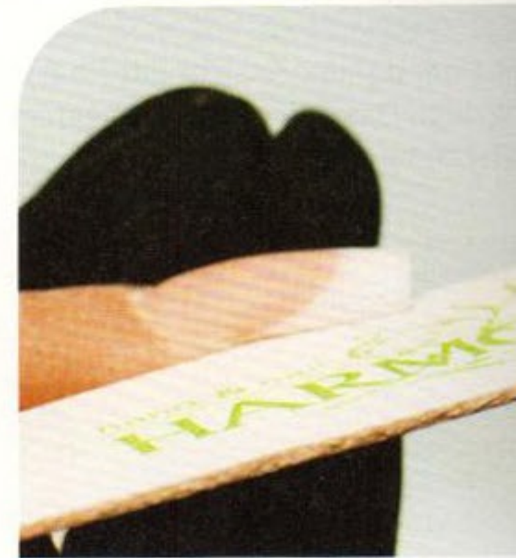
4 Die Befeilung beginnt mit den Streifenlinien, danach werden die Länge und die Oberfläche bearbeitet. Alle Feilschritte werden mit einem Buffer wiederholt.